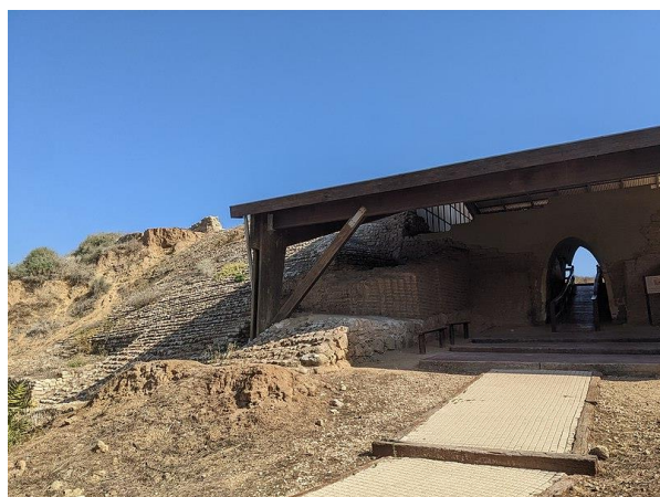
Ashkelon – The Canaanite City Gate & Ramparts