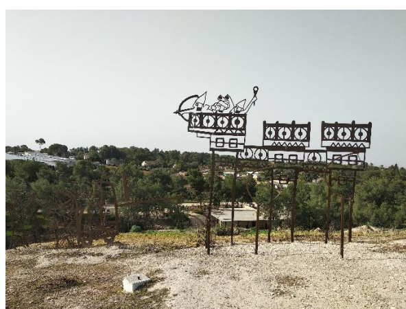
The Battle of Tel Lachish