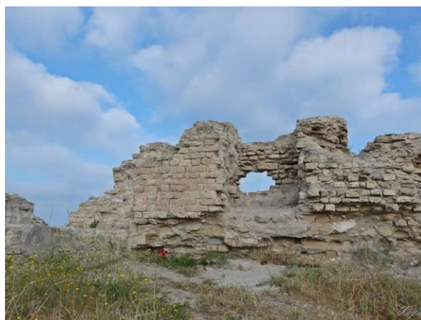
The Walls of Ashkelon